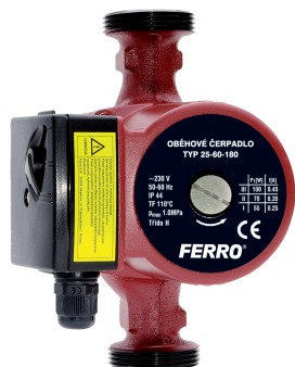
W0202 Oběhová čerpadla FERRO pro pitnou vodu